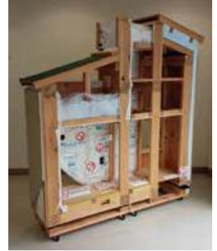
※断熱施工模型の説明はございませんが、会場に展示しておりますので自由にお写真をお撮り下さい。